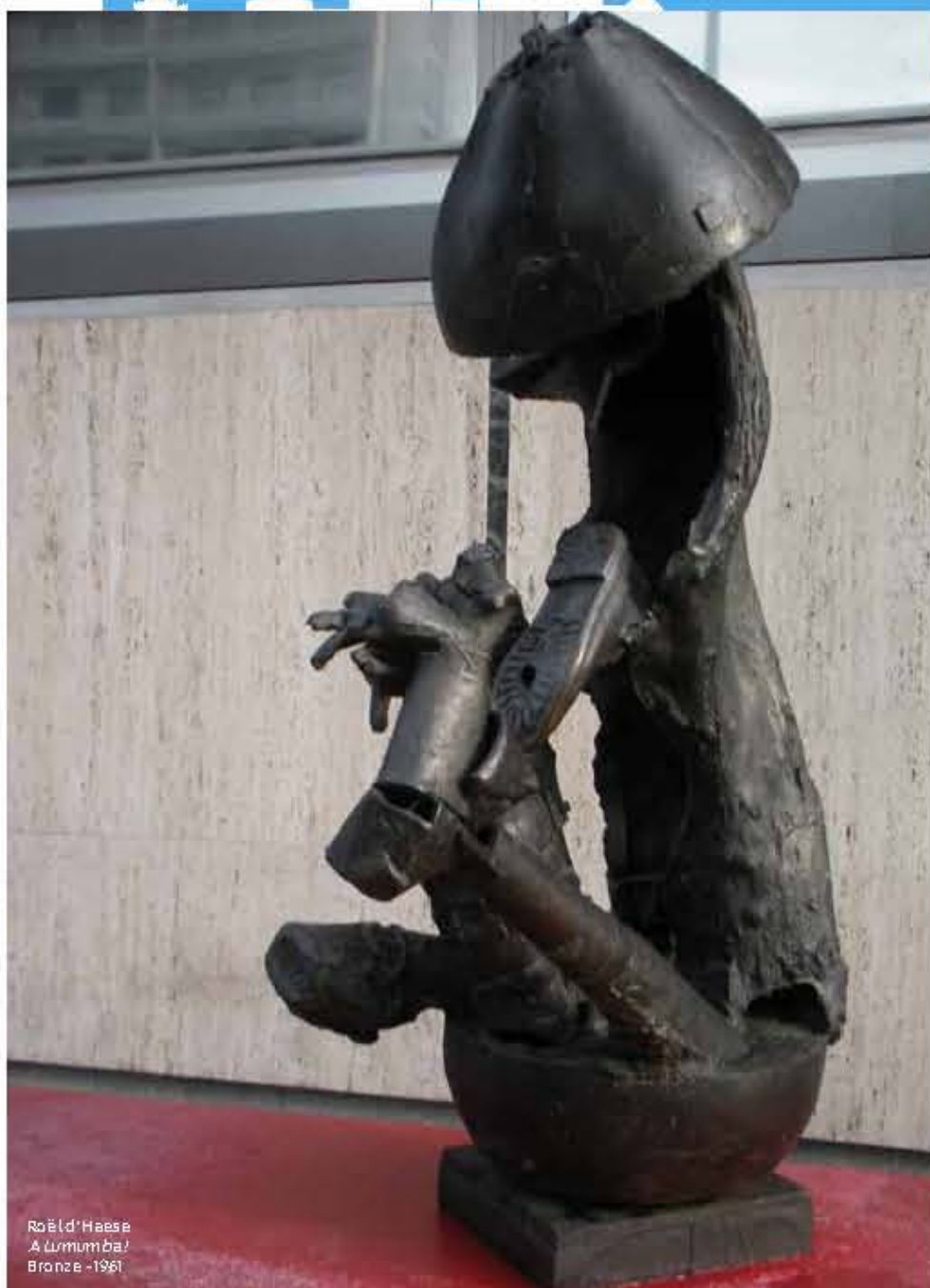
Roël d'Haese A Lumumba! Bronze - 1961