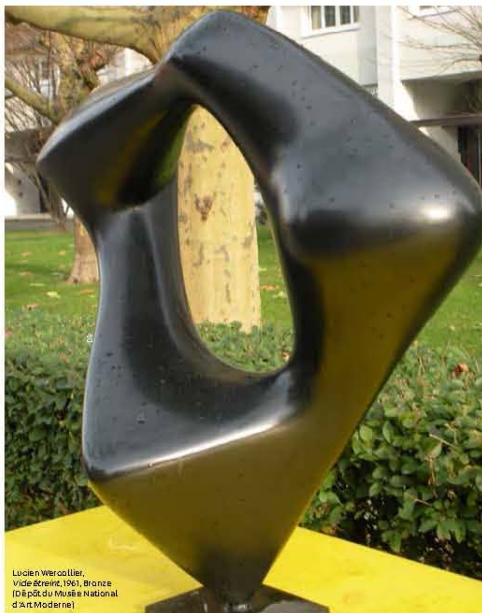
Lucien Wercollier, Vide étreint, 1961, Bronze (Dépôt du Musée National d'Art Moderne)